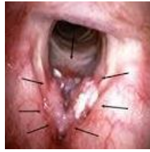
両側声帯から声門下に進展した癌